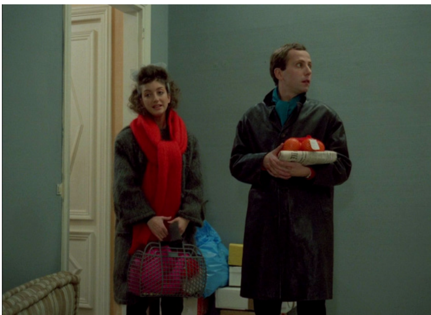
Figura 1 14