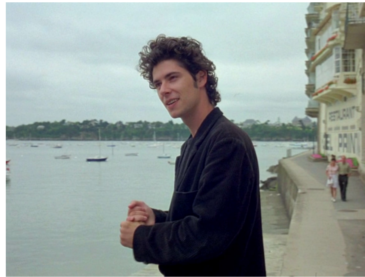
Figura 14, Rohmer estabelece os dois personagens frente a frente para o diálogo, fazendo em plano e contraplano.