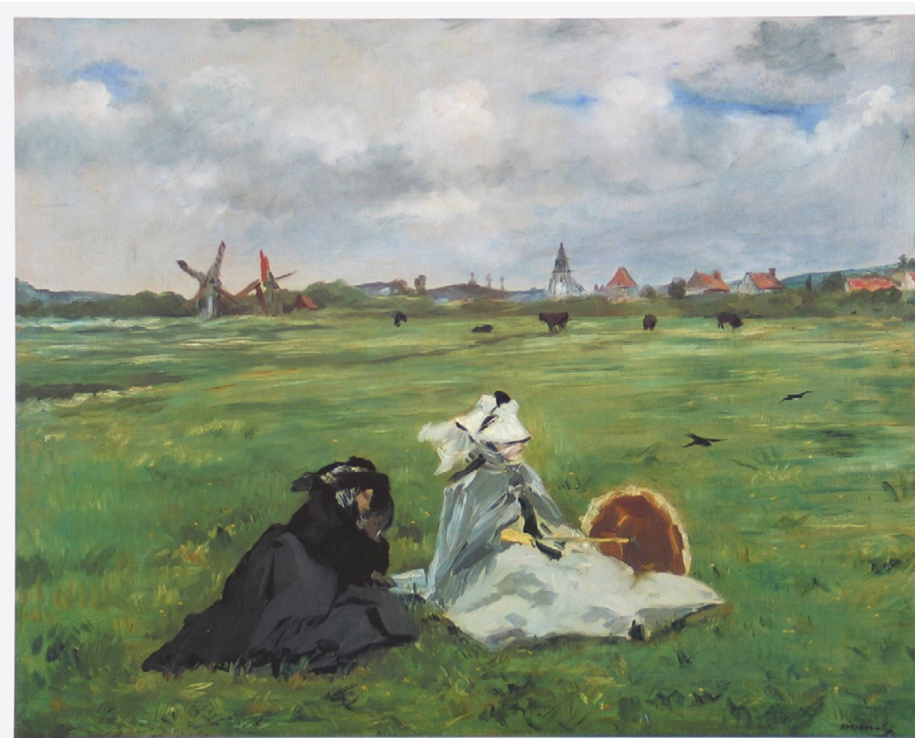
Figura 19 – Andorinhas (Hirondelles) , 1873, de Edouard Manet

Fonte: Edouard Manet (1873), óleo sobre tela, 65×81 cm, coleção Fundação E. G. Bührle, Zurique