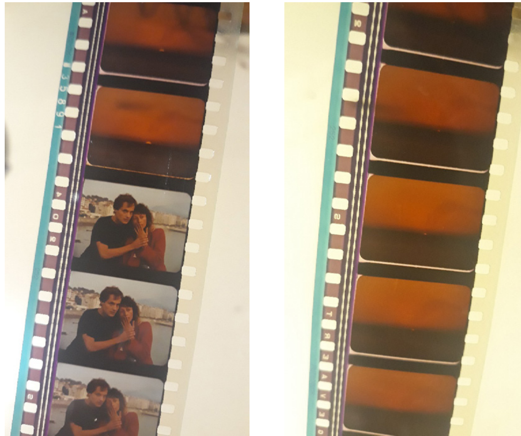
Figuras 25 e 26 – Imagens da película em 35mm de O Raio Verde . A figura 26 mostra os últimos quadros com o raio verde