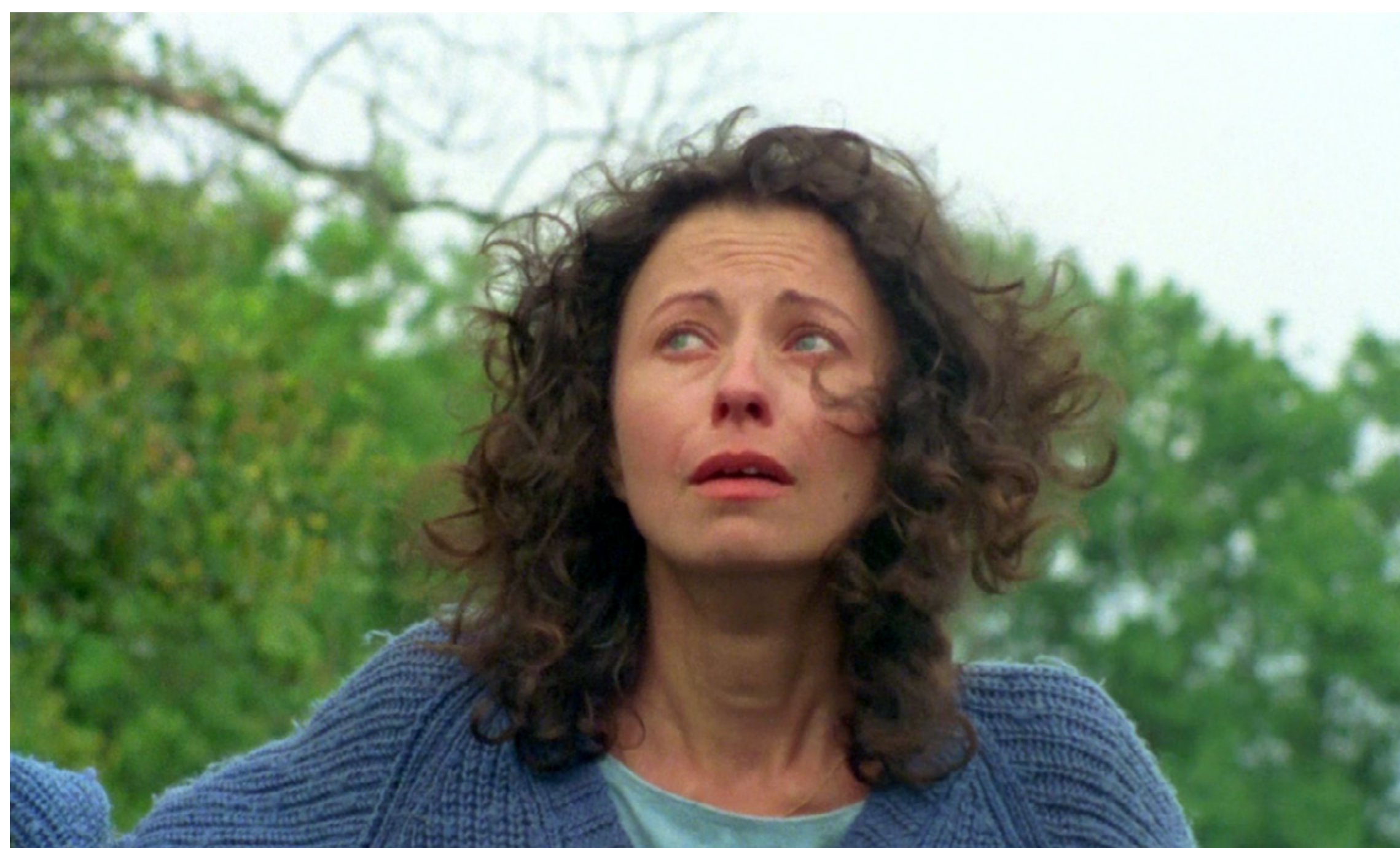
Figura 29 – Cena de O Raio Verde