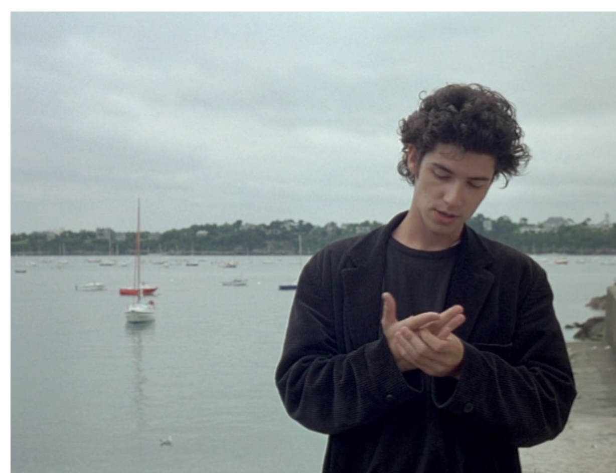
Figura 16, os planos se intercalam com a conversa.